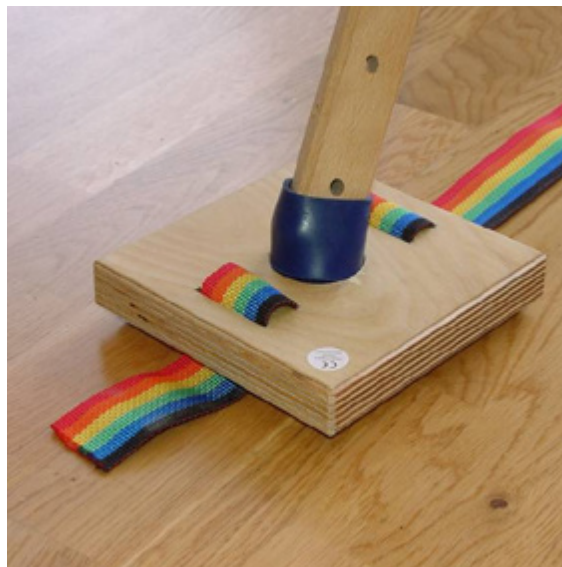
Schritt 4: Montage der Fußplatten mit den Gurtbändern