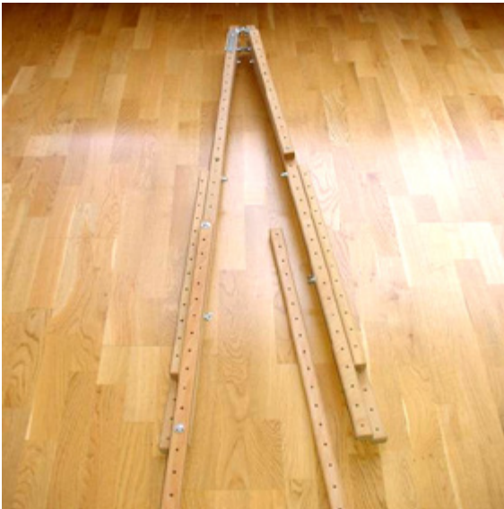
Schritt 1: Montage der FüÙe