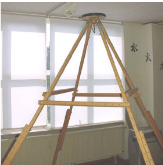
Schritt 3+5: Aufstellen und Montage der Stabilisierungsleisten