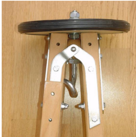
Schritt 2: Montage Holzscheibe mit Haken