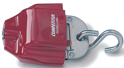
Spannschloss Art.Nr. 11 150 6323

Wenn die Leine unter Spannung ist, niemals Sperrklinke mit Ratsche schlagen, um Spannschloss zu lösen. Rolle nicht frei laufen lassen. Das beschädigt die Zahnung und führt zum Rückschlag des Kabels. Das ist auch für den Anwender gefährlich.