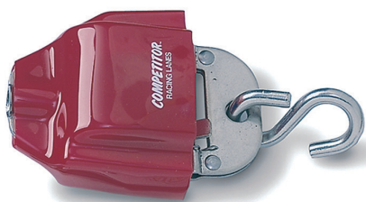
Turnbuckle Art.No. 11 150 6323

When reel is under tension never hit thumb pawl with ratchet wrench to release catch lock. Do not allow reel spool to run free. This will damage teeth on spool and cause backlash of cable. It is also dangerous to operator.