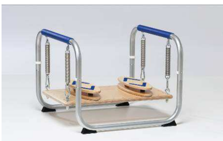
auf pedalo® - Stabilisator - Sport Copyright © Holz-Hoerz