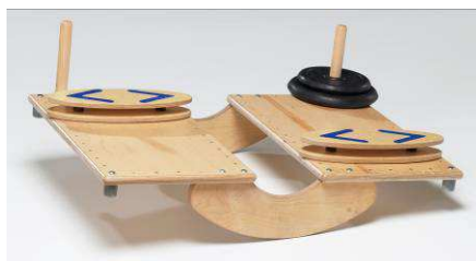
auf pedalo® - Reha - Wipp