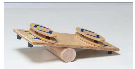
auf pedalo® - Rola – Bola