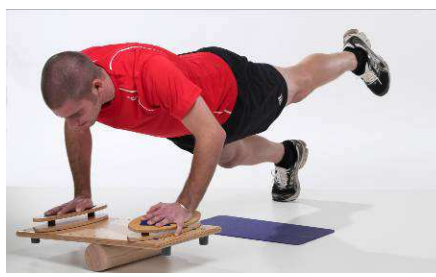
Auf pedalo® Rola - Bola