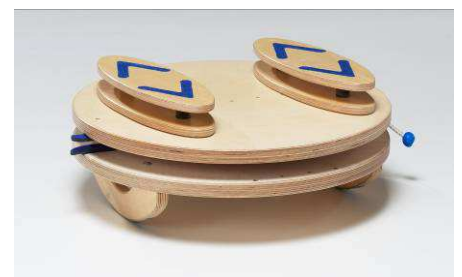
auf pedalo® - Dreh - Wippbrett