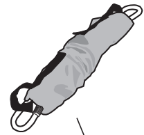
Federsystem weich oder hart