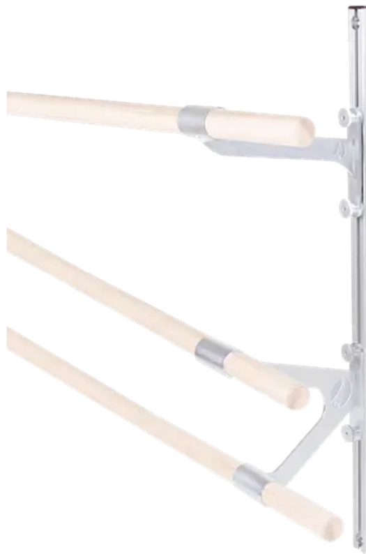
Abbildung 1: Ballett-Schiene für Ballettstangen-Wandhalter

Bewahren Sie die Anleitung gut auf. Für Fragen und Wünsche stehen wir Ihnen gerne zur Verfügung.