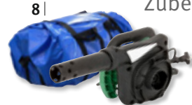
Profi Handgebläse, Adapter, Tasche

(Zubehör auch im Online-Shop bestellbar)