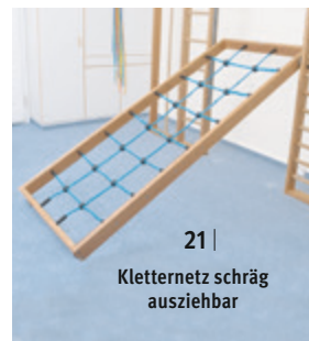
21| Kletternetz schräg ausziehbar