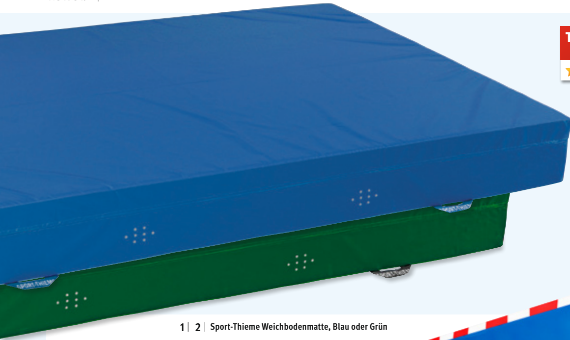
1 | 2 | Sport-Thieme Weichbodenmatte, Blau oder Grün