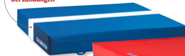
1 | Sport-Thieme Weichbodenmatte, Blau-Rot

✓ Weisse, haptische Linie dient der Orientierung bei Landungen