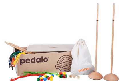
Pedalo Teamspiel-Box „4MOVE“