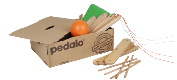
Pedalo Teamspiel-Box „Zwei“