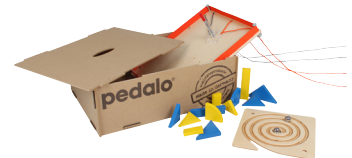
Pedalo Teamspiel-Box „Drei“