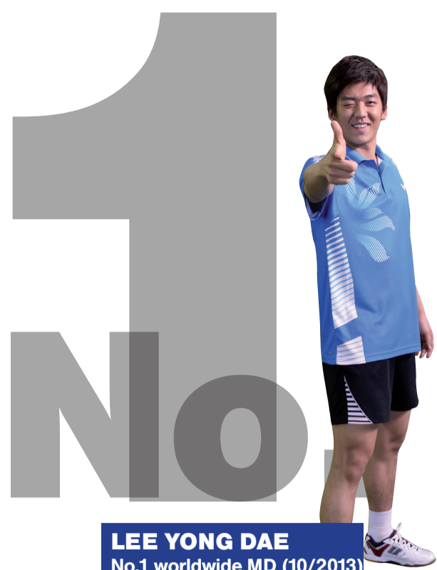
LEE YONG DAE No.1 worldwide MD (10/2013) plays V-Brave Sword LYD