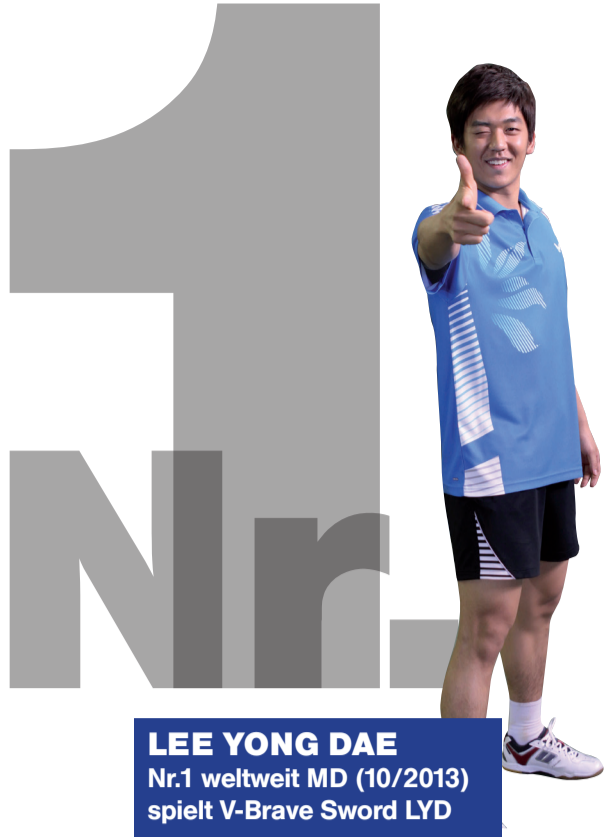
LEE YONG DAE Nr.1 weltweit MD (10/2013) spielt V-Brave Sword LYD