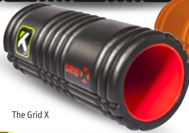
The Grid X