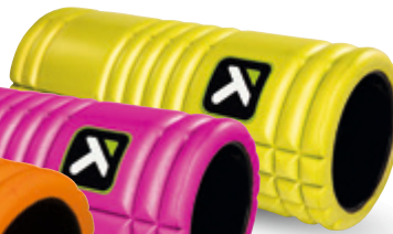
The Grid 1.0