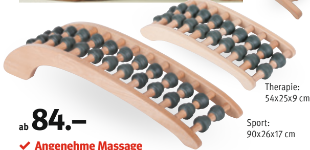
Therapie: 54x25x9 cm