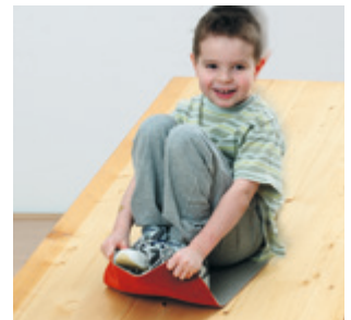
Umgedreht auch zum Rutschen geeignet