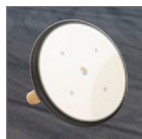
Für den Aussenbereich